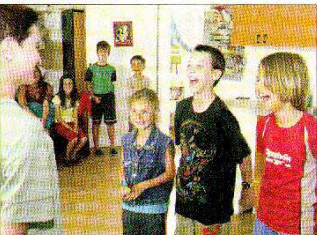
Absolutní superhvězdou se nakonec stal dvanáctiletý Honzík, skutečný šoumen.