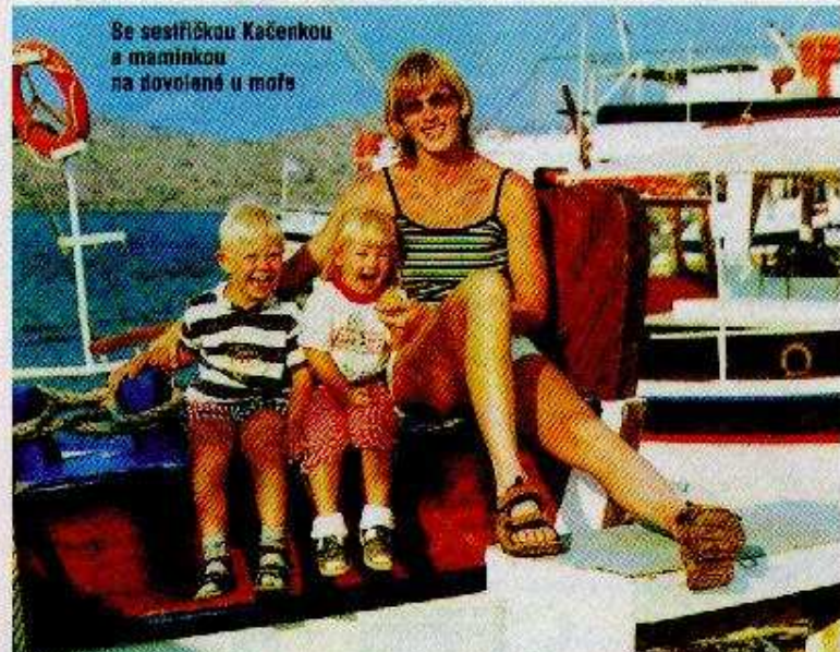
Se sestřičkou Kačenkou a maminkou na dovolené u moře

Příčinou vzniku této nemoci jsou poruchy ve skladbě chromozómů v zárodečných buňkách. Děti mají malou lebku, úzké a šikmé oční stěrby, malý a tupý nos, ruce jsou tlavovité s krátkými prsty. Poetava je menší a zavalitější. Stupeň slabomyslnosti je různý. Děti jsou přítulné, mazlivé a dobrácké. Mají velmi vyvinutou schopnost napodobování.